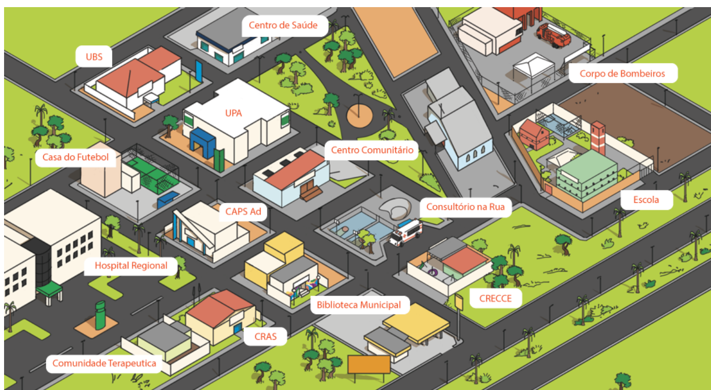
Figura 2: Mapa que ilustra os elementos estruturais do Tratamento Comunitário. Fonte: NUTE - UFSC (2016).

O mapa abaixo ilustra, no dia a dia do trabalho com a comunidade, os elementos estruturais (o SET ou o dispositivo material) do Tratamento Comunitário. O conceito central dessa abordagem é que tudo que existe na comunidade pode ser utilizado como dispositivo para o Tratamento Comunitário. A partir dessa perspectiva, a comunidade possui muitos recursos.